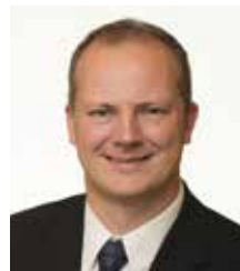
Samferdselsminister Ketil Solvik-Olsen

Velkommen til interessante og lærerike dager i Stavanger!