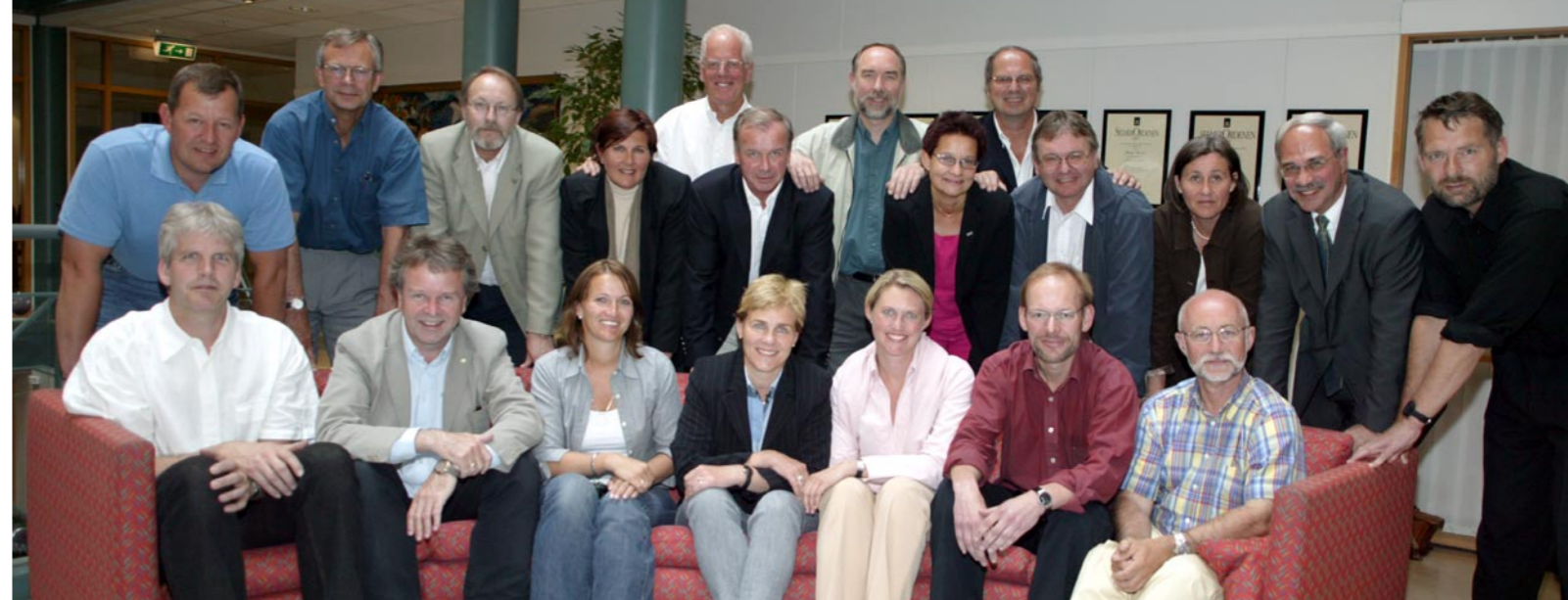
Engasjerte deltagere. 16. juni møttes 23 medlemmer i Næringslivsringen i Oslo for å diskutere den videre virksomhet i foreningen.

Isola AS Norbetong Norcem AS Norsk Hydro Optiroc as Protan AS Rescon Mapei AS Scancem Chemicals Sika Norge AS Ølen Betong